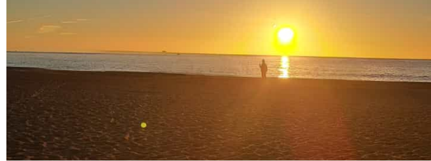
Al-Anon y Alateen área 2 Barcelona - Girona

“¡QUÉ BELLA ES LA VIDA, SI APRENDO A VIVIRLA!”